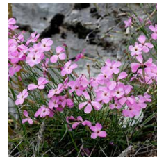
Dianthus sylvestris Garofano selvatico