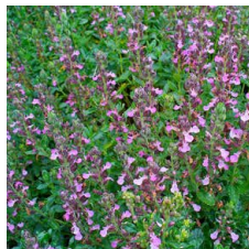
Teucrium chamaedrys Camedrio comune