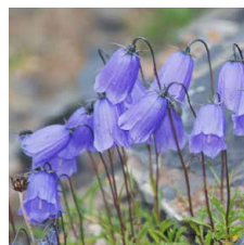
Campanula cochleariifolia Campanula con foglie a cuc- chiaio