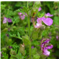
Teucrium botrys Camedrio grappoloso