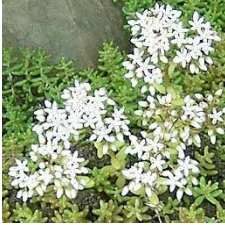
Sedum album Borracina bianca