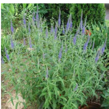
Veronica spicata Veronica spigata