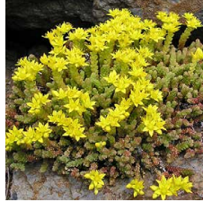
Sedum acre Borracina acre