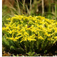
Sedum sexangulare Borracina esagonale