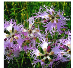
Dianthus superbus Garofano superbo