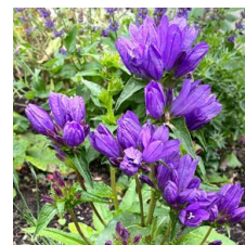
Campanula glomerata Campanula glomerata