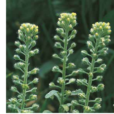
Alyssum alyssoides Alisso calcicino