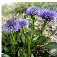
Globularia bisnagarica Globularia minore