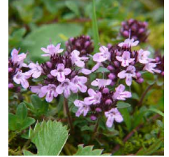
Thymus praecox Timo precoce